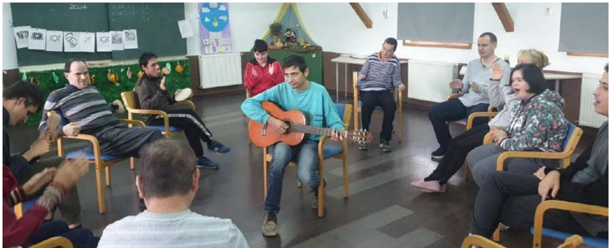
Timon bringt Musik in Pantelimon

Und wenn sich irgendwann eine noch bessere Gelegenheit ergibt, dann werde ich es diesmal auch schaffen mich mit Benni und Bella, den beiden Wachhunden anzufreunden.