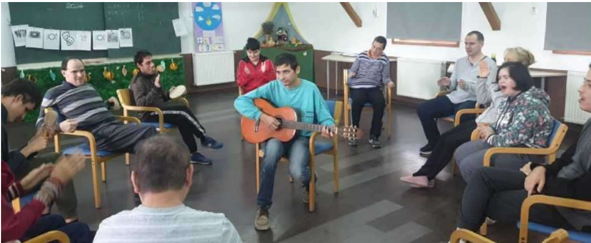
Timon aduce muzică în Pantelimon și se bucură (în portocaliu) alături de comunitate

Iar dacă se va ivi o ocazie și mai bună, atunci de data aceasta voi reuși să mă împrietenesc și cu Benni și Bella, cei doi câini de pază.